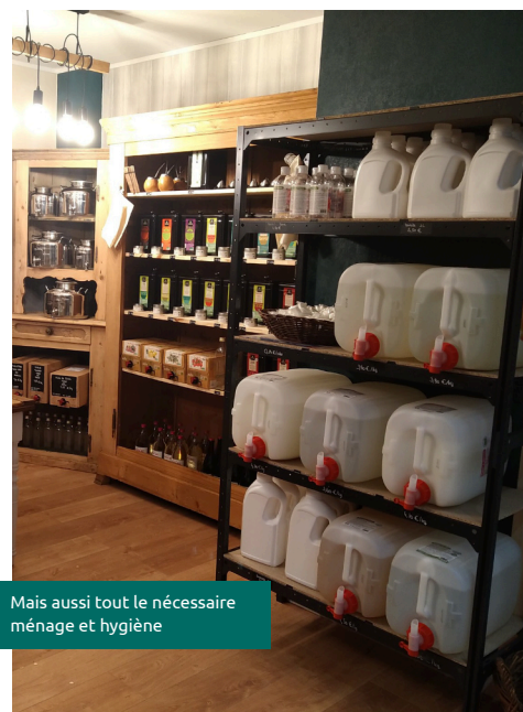
Mais aussi tout le nécessaire ménage et hygiène