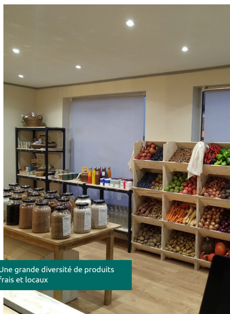
Une grande diversité de produits frais et locaux

site Web facebook.com/epiceriegsundervrac