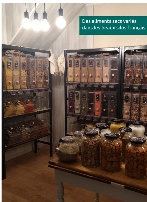
Des aliments secs variés dans les beaux silos français !